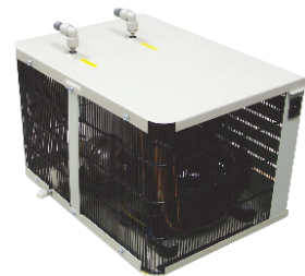
UC800M Refroidisseurs sous évier