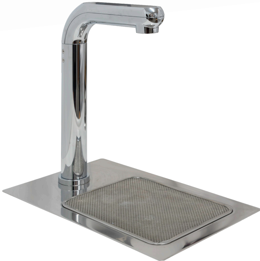
(Robinet accompagné du plateau d'égouttage Ezytray3)